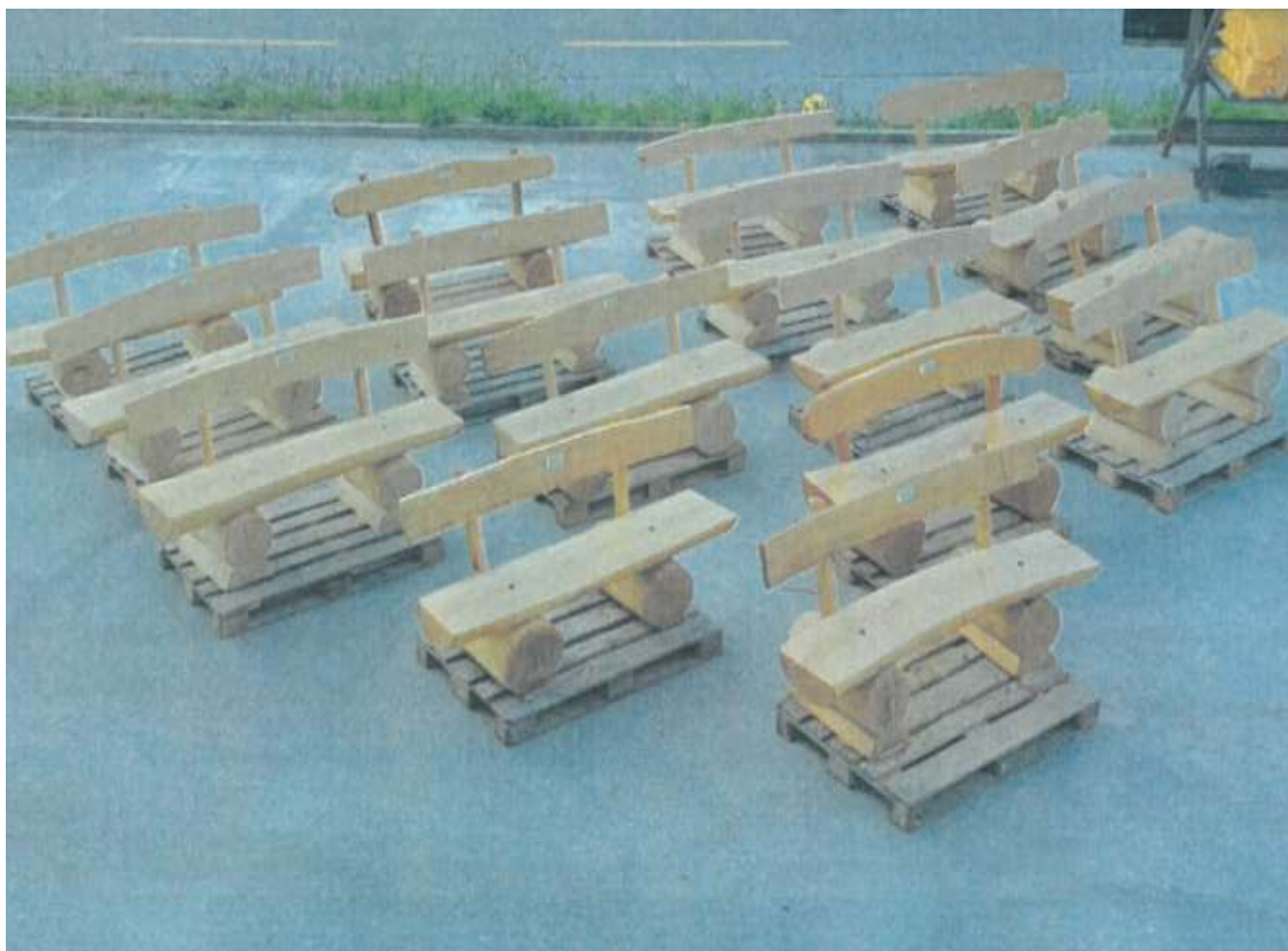
Die 16 Sitzbänke auf dem Gelände des Forstbetriebes Solothurn

Der Forstbetrieb Solothurn ist spezialisiert auf die Produktion von Sitzbänken aus einheimischen Stammholz. Die Herstellung von Bänken ist ein „Nebenbeschäftigung“ und kann nur zu Zeiten vorgenommen werden, in denen die Arbeit im Wald nicht oder nur bedingt möglich ist. Einerseits hat dies die Herstellung verzögert, andererseits aber die Anschaffungskosten reduziert, was jedoch die Anschaffung von 16 Bänken erlaubte.