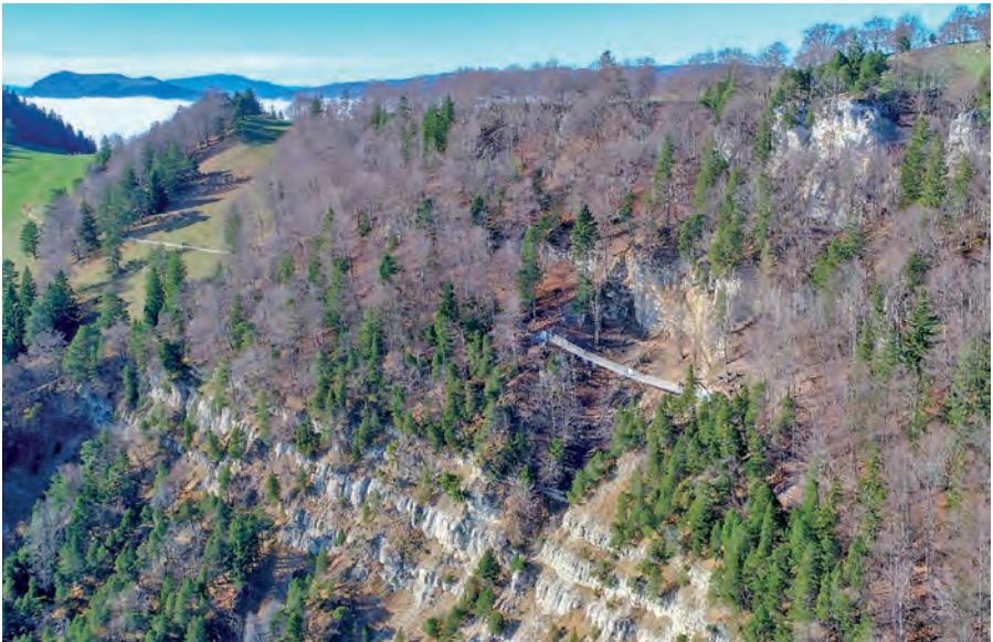
Neue Hängebrücke im «Gschliff»