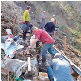
Während dem Bau