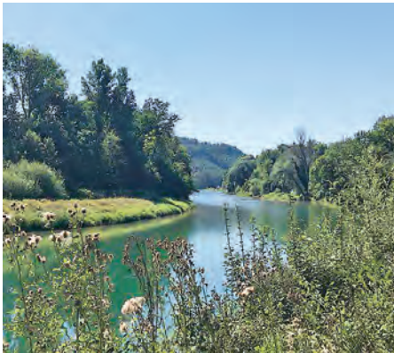
Auf dem linken Aareuferwanderweg im Naturschutzgebiet Richtung Schönenwerd

In unserem Auftrag war auch dieses Jahr die Oltech unterwegs. Wiederkehrend wurden durch sie an rund 5,3 Kilometern der Wanderwege zurück- und freigeschnitten. Ganz herzlichen Dank an das Oltech- Team von Walter Kiener.