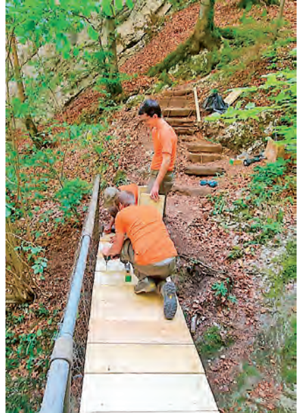
Wolfschlucht RZSO Thal-Gäu