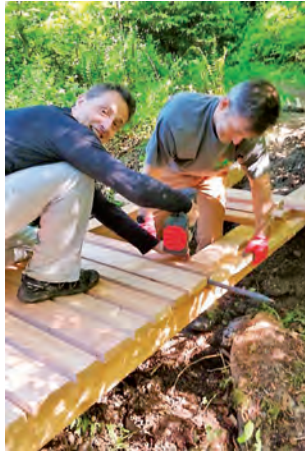
Während dem Bau