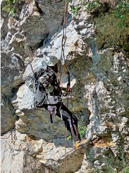
Felsreinigung Küferegg Selzach