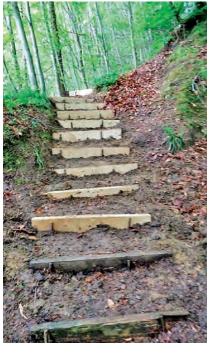
Die neuen Treppenstufen

Beides lässt sich gleichermassen sehen, die Lions-Truppe und die neue Treppe. Zum Abschluss der fast 4 stündigen Aktion durfte natürlich der gesellschaftliche Teil mit Speis und Trank nicht fehlen und so wurde dieser «Arbeitseinsatz» für alle ein erfolgreiches Erlebnis.