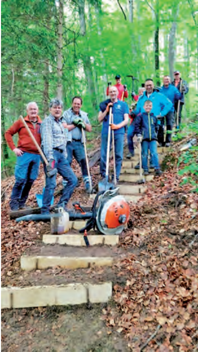
Die Lions – Helfer Truppe